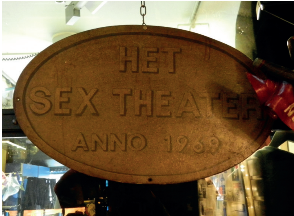
Het originele schild dat ooit boven de ingang van het Sex Theater pronkte, hangt nu (foto uit 2015) in coffeeshop The Bulldog, Oudezijds Voorburgwal 90 — het toenmalige buurpand van het Sex Theater.

Ik heb zo veel vuiligheid in me leven gezien, en onrecht niet te vergeten, en wat ik nog dagelijks om me heen zie gebeuren, en het zou toch zonde zijn om zoiets niet te beschrijven. Al is het alleen maar voor onze nakomelingen, die dan later kunne lezen hoe en wat een vies zootje het is geweest in de jaren zestig en zeventig en de hele negentiende eeuw. 1