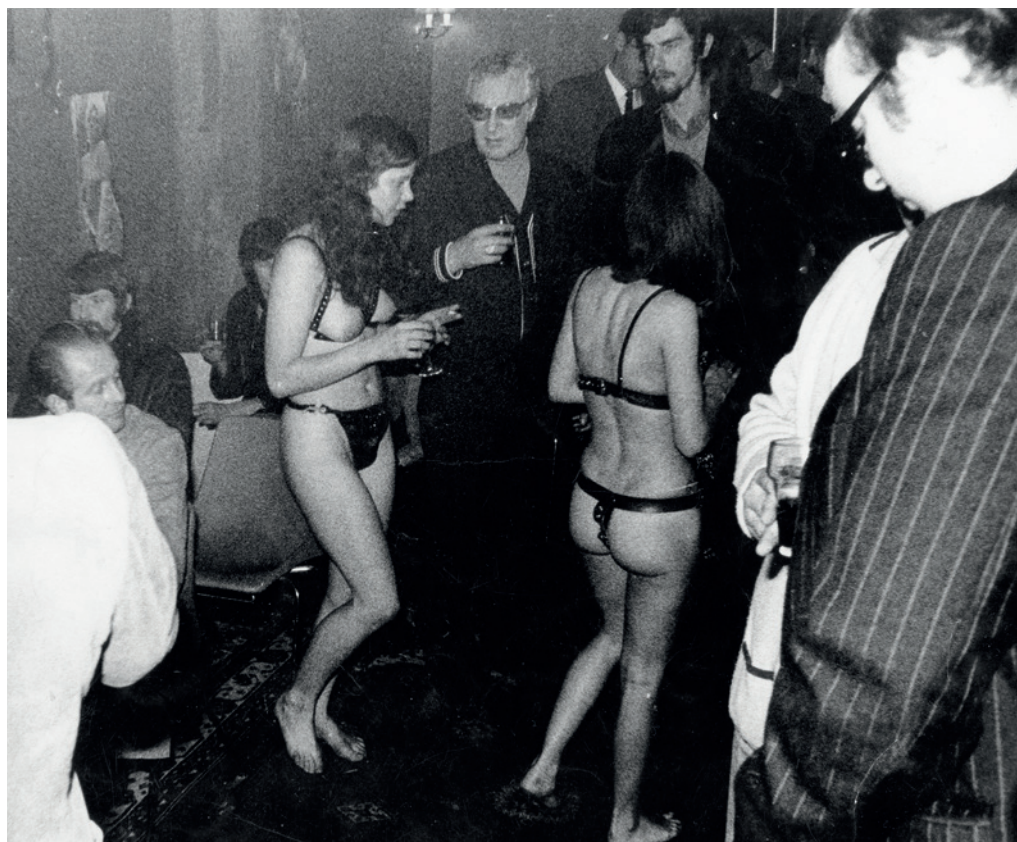
Arie te midden van feestgangers tijdens de opening van het Sex Theater, 23 november 1969.

Maar als toetje, ik was al goed lazerus, heb ik ook nog een tripties show gegeven, door me langzaam uit te gaan kleden, en toen met een grote gummiepop in me blote togus over het podium te gaan rollebolle.