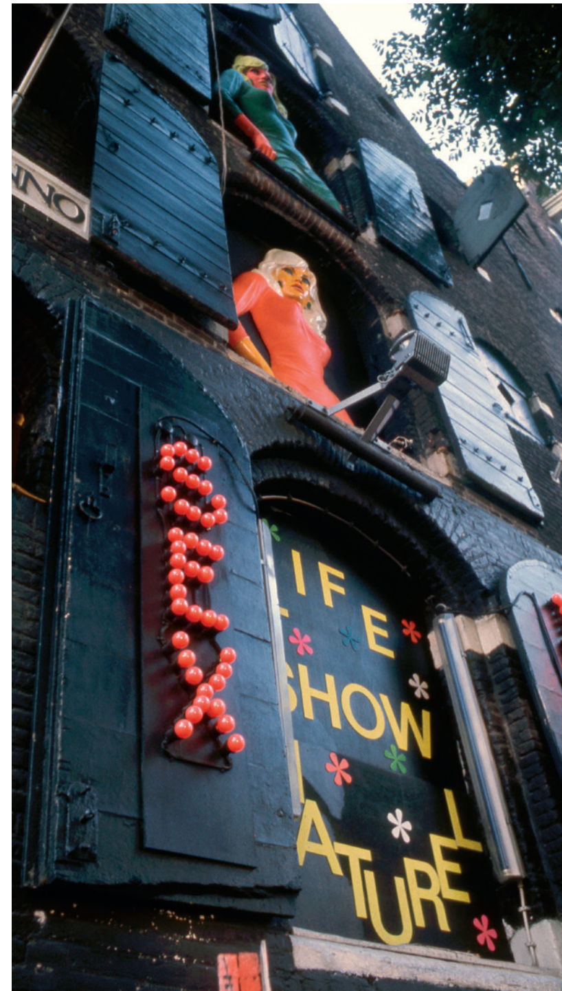
Het tweede Sex Theater, 1972-1973.

Ik liep steeds heen en weer door die boot, om te vragen wie er nog wat te zuipen wilde hebben, tot ik achterin een paar jongens met een morkeltje bezig waren der broek van der reet te trekken. Die mafketel had ik die middag leren kennen als dat ze journaliste was van het één of ander blaadje, ik geloof de Kiekeboe, een lekkere