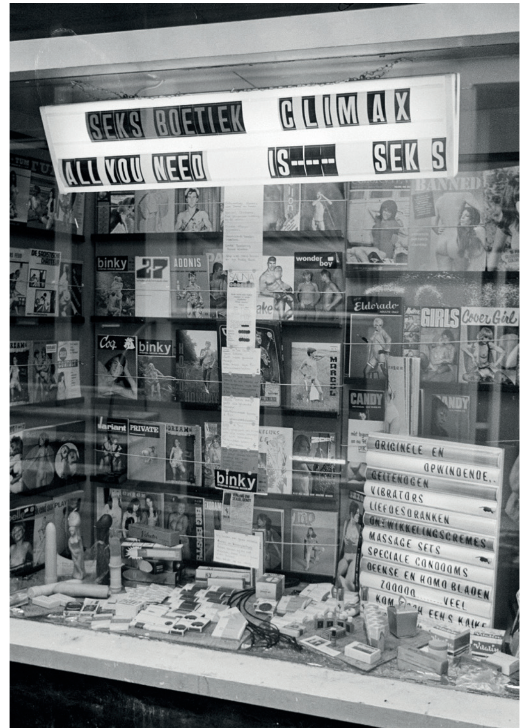
Seksshop in Amsterdam, 19 januari 1971.